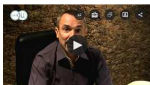
La transformation digitale des entreprises http://bit.ly/2DX9swO