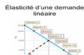
Les élasticités de la demande http://bit.ly/2nxW8J6

Ces ressources numériques sont de simples illustrations des cours que les lycéens seraient amenés à rencontrer.