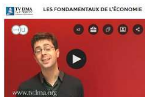
Fondamentaux de l'économie http://bit.ly/2DWqfAn