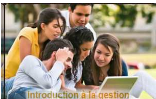
Introduction à la gestion http://bit.ly/2DZm5vy