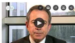
L'information au cœur de l'intelligence économique http://bit.ly/2nvH4LZ