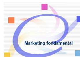
Marketing fondamental http://bit.ly/2DWqfAn