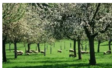
Qu'est-ce que l'agroécologie ? https://tice.agroparistech.fr/coursenligne/courses/INTROAGROECOLOGIE/document/uvae_agroecologie_intro/co/_web.html