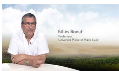
L'Humain dans la biodiversité https://www.uved.fr/fiche/ressource/1298/