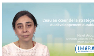
Les objets du développement durable (9 vidéos) https://www.uved.fr/fiche/ressource/772/