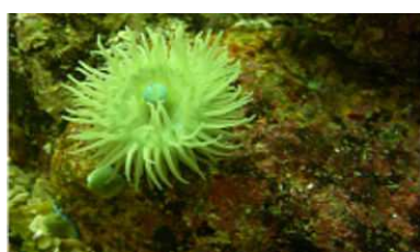
La biodiversité méditerranéenne http://www.php.obs-banyuls.fr/UVED/