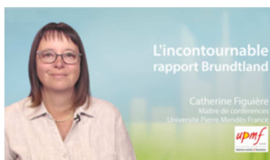
L'incontournable rapport Brundtland https://www.uved.fr/fiche/ressource/634/