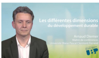
Les différentes dimensions du développement durable https://www.uved.fr/fiche/ressource/658/