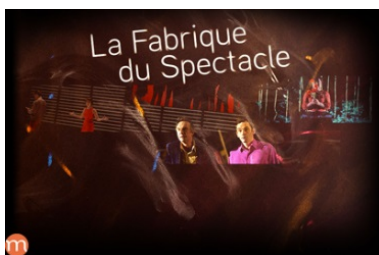
La fabrique du spectacle http://bit.ly/21U25xk