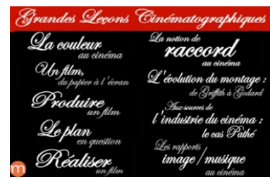
Grammaire cinématographique http://bit.ly/2rX6c39