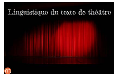
Linguistique du texte théâtral http://bit.ly/1yUmguk