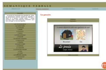
Présentation de la sémantique verbale http://bit.ly/2Fwqa6z