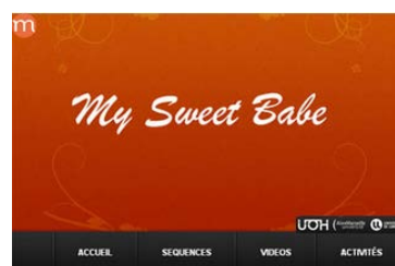
Anglais – niveau B2 http://bit.ly/2rUldkT