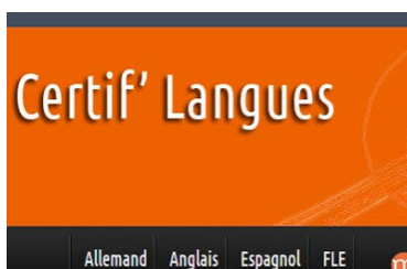
Niveaux B1/B2 http://bit.ly/1BoK417