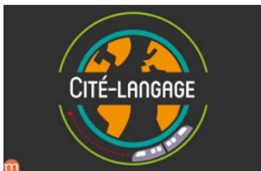
Introduction aux sciences du langage http://bit.ly/2Fx02ss