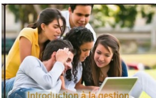
Introduction à la gestion http://bit.ly/2DZm5vy