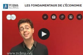
Fondamentaux de l'économie http://bit.ly/2DWqfAn