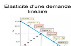
Les élasticités de la demande http://bit.ly/2nxW8J6

Ces ressources numériques sont de simples illustrations des cours que les lycéens seraient amenés à rencontrer.