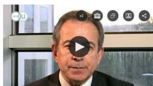
L'information au cœur de l'intelligence économique http://bit.ly/2nvH4LZ