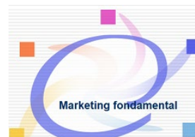
Marketing fondamental http://bit.ly/2DWqfAn