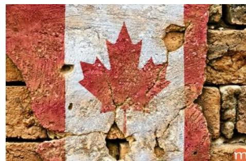
La géographie du Canada et sa diversité culturelle