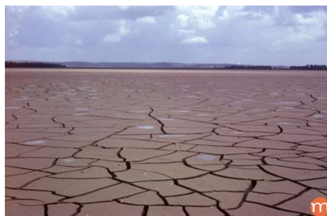
La dégradation des sols dans le monde