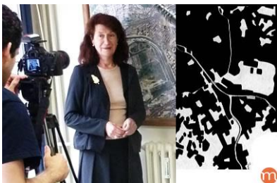
Paris et les banlieues, naissance d'un espace urbain