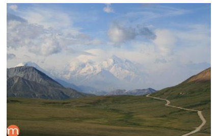
Dynamiques et enjeux des biodiversités et des agro-ressources