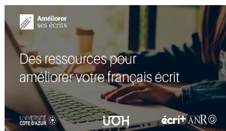
Améliorer ses écrits