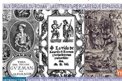
Aux origines du roman : la littérature picaresque espagnole