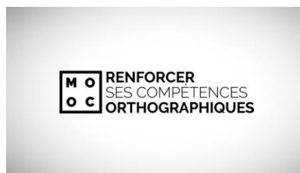
Renforcer ses compétences orthographiques