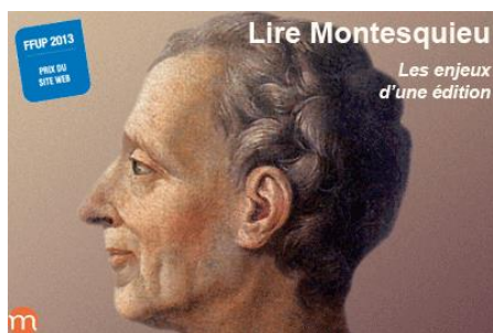
Lire Montesquieu, les enjeux d'une édition