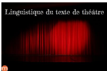
Linguistique du texte de théâtre