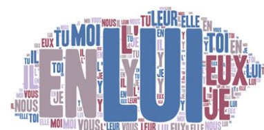
Les pronoms personnels du français